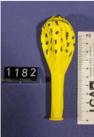
blaue Druckfarbe / blue printing ink