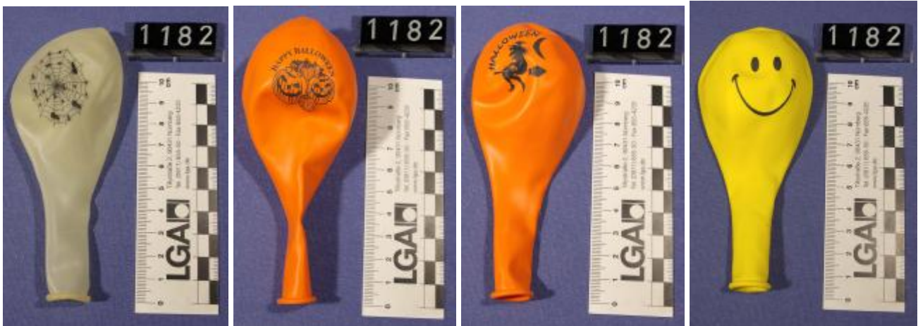
schwarze Druckfarbe / black printing ink