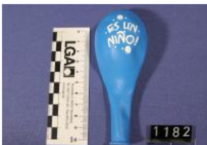
weiße Druckfarbe / white printing ink